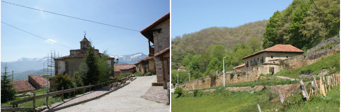
Dos aspectos de San Mamés

San Mamés tiene un patrimonio construido de gran valor, con magníficas casonas solariegas como la casa de “Fuente Antigua” a la entrada del pueblo; la de los “Montes Caloca”, con un impresionante escudo en su fachada que como decía Unamuno en Paisajes del alma: “volviendo a ver el más hermoso escudo de armas que he visto en una casa solariega de los Montes, en San Mames,.... era como cosa de magia”; la casa rectoral y otras. En el antiguo camino de entrada al pueblo, existe un humilladero. La Iglesia del siglo XVII, es de estilo barroco montañés con ábside poligonal.