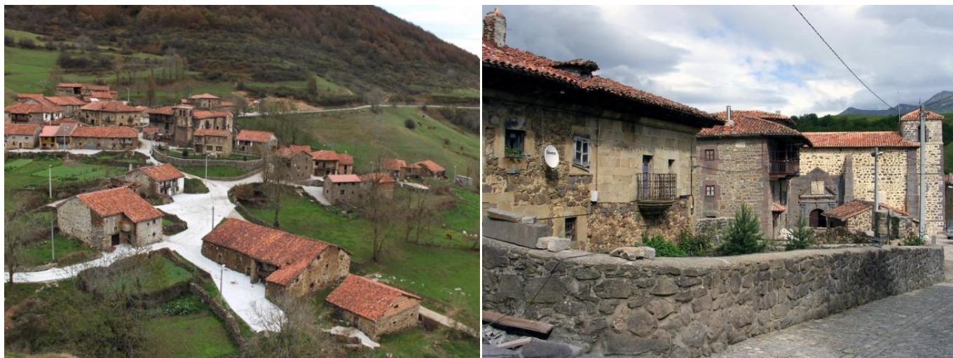
Vista general de Tresabuela y barrio de la iglesia

pueblo adosada a otra casa-torre junto a la fuente y por supuesto la casa-torre confinante con la iglesia parroquial que perteneció a la familia Rávago.