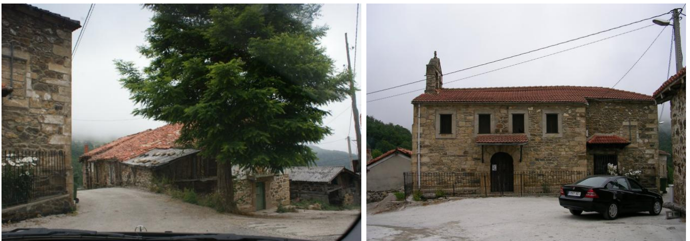
Dos aspectos de Belmonte

Desde la entrada a San Mamés (1027 m) se va por la calle que queda de frente (SO) y enseguida aboca a una plazoleta, donde se irá a la izquierda (S-SO) por la calle que baja hasta llegar a la última casa del pueblo, detrás de la cual se toma un camino que entra en un bosque de hayas y robles y después de un par de zigzags baja a cruzar el Río de la Guariza (918 m), para después subir al pueblo de Belmonte (1025 m), donde hay un hórreo, declarado Bien de Interés Cultural y su Iglesia data del siglo XVIII.