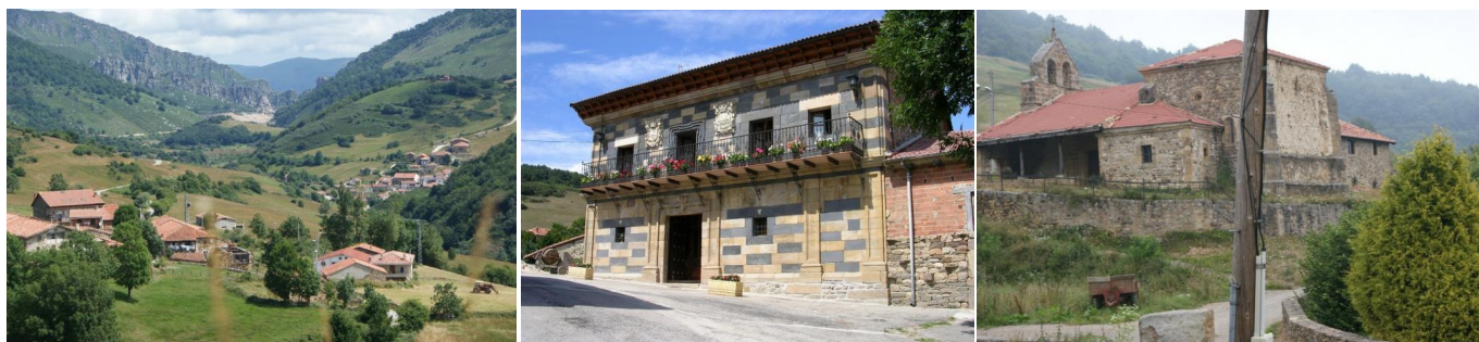
Lombraña: Vista general; Casa de la Cotera; Iglesia de la "Santa Cruz de Lombraña".

Este pueblo es la capital del Municipio Valle de Polaciones, donde está ubicado su Ayuntamiento. Lombraña tiene algunas interesantes muestras de arquitectura. Su iglesia, a la que se conoce con el nombre de la "Santa Cruz de Lombraña", presenta restos románicos en la espadaña y en una ventanita de medio punto, con rústicos capiteles del siglo XII. El resto del edificio es de los siglos XVI y XVII.