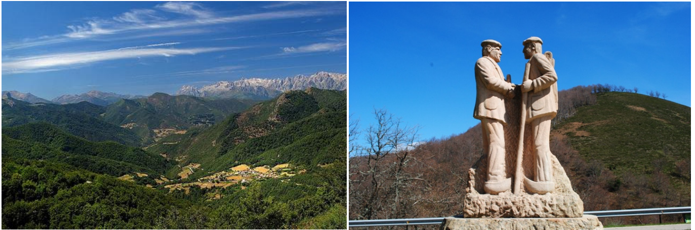
Mirador de la Cruz de Cabezuela: Cabecera del valle de Valdeprado, cubierta por frondosos hayedos, con el telón de fondo de los Picos de Europa. Eescultura el Encuentro entre un Purriego y un Lebaniego.

izquierda, entre las hayas del Monte de las Llamas. Poco más de un km después se llega a las primeras casas de Salceda (1022 m).