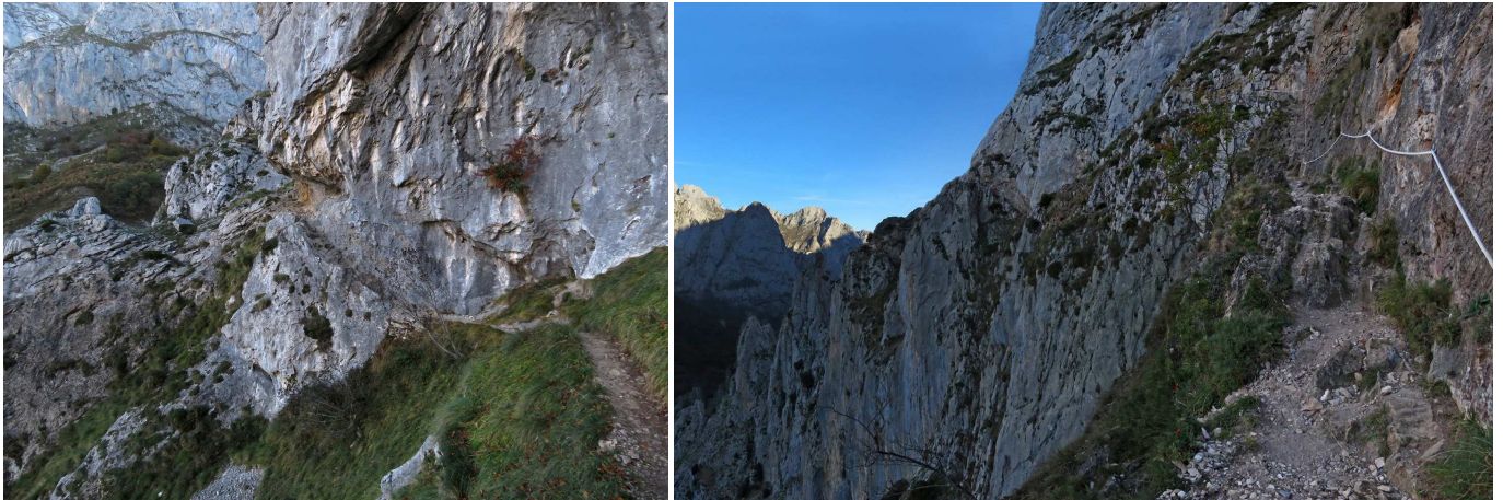
Dos aspectos de la Senda de la Rienda.

seis son hórreos y séptimo un molino de agua recién restaurado de indudable belleza. Como dato curioso, decir que, de una ermita ya desaparecida, que estuvo dedicada a Santiago, queda todavía el topónimo “Campos de Santiago” en la zona donde estuvo ubicada.