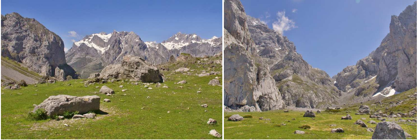
Vistas desde la Vega de La Sotín: Hacia el NO, Torre Bermeja y Peña Santa de Castilla y al SE la Canal de La Sotín.

camino (1870 m) que viene de la Vega de Liordes (por la derecha) para seguir bajando (izquierda) por esta estrecha canal, que no se amplía hasta alcanzar la Vega de La Sotín (1407 m).