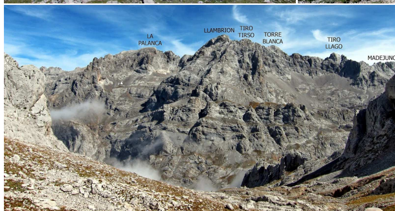
Vista de la Canal de la Chávida desde su parte inferior.

La canal, desde el Collado de la Chávida con todos los montes hacia el SE y S.