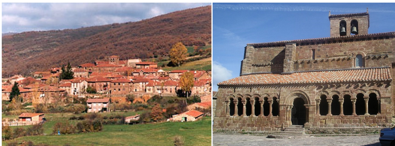
Vista de Pineda de la Sierra y detalle de la galería porticada de su iglesia de San Esteban Protomártir.

Pineda de la Sierra, cuyo nombre parece provenir de "Pinus-Pineta", por a la abundancia de pinos en la zona, tiene su caserío repartido entre dos barrios separados por las aguas del Arroyo de Barranco Malo. En la parte derecha se encuentran las casas nobles de piedra arenisca rojiza, verdaderos palacios en algunos casos, que fueron levantadas en los siglos XVII y XVIII por ricos ganaderos. Pineda tiene, además, un puente románico que une a los dos barrios.