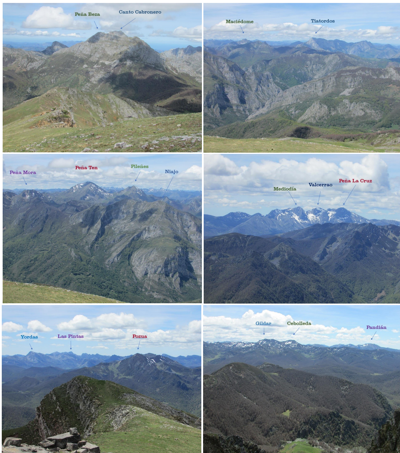
Vistas desde el Pico Jario.

Por detrás del mirador sale un buen sendero que bordea el Pico Camborisco, que en Oseja lo llaman Comborisco o Pico de la Rocha, por su ladera oriental (queda a la izquierda). Dicho sendero sube y baja, bien por bosque, o entre brezos y escobas, o atravesando pequeñas pedreras, hasta alcanzar la Riega Guayes, donde la dirección cambia a NO, comenzando una subida por la canal excavada por este arroyo entre los picos Camborisco (izquierda, SO) y Piedrashitas NE) al final de la cual se alcanza El Collado de la Majada de Piedrashitas (1529 m), donde hay un poste indicador. Se sigue por una loma en dirección O-SO entre monte bajo, hasta llegar al Collado Viejo (1639 m) donde un hito marca la línea divisoria entre Sajambre y Valdeón.