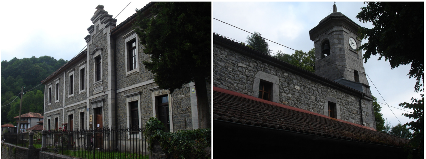
Soto de Sajambre: Escuela e iglesia.

Se atraviesa el pueblo calle abajo, pasando junto a la Iglesia del siglo XVI y unos metros más abajo junto al magnífico edificio de piedra de dos plantas de la escuela construida a expensas del gran mecenas que fue Don Félix de Martino (natural de Soto y emigrado a Méjico donde hizo su fortuna). Esta escuela construida con la aportación de muchas horas de trabajo del vecindario fue inaugurada en agosto de 1906 contando con un material didáctico único para aquella fecha.