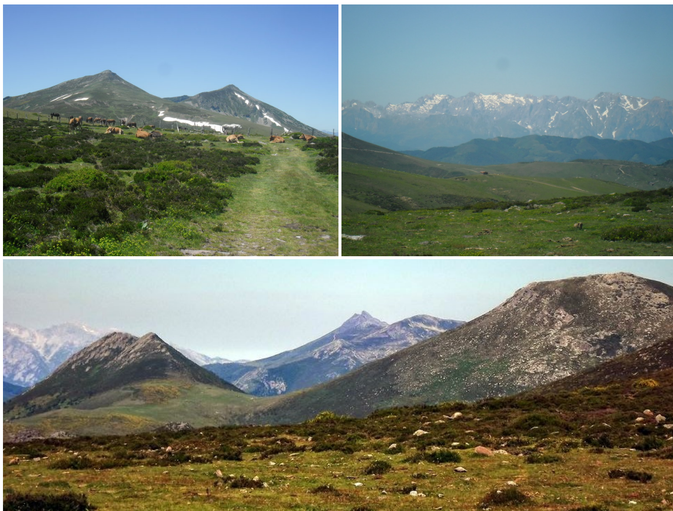
Vistas desde el Collado de Rumaceo: Al SO Pico Liguardi y Pico Cordel. Al NO los Picos de Europa. Al N-NO Los picos Helguera y La Concilla (derecha), separados por la Canal del Hitón y, encima de ésta el Cornón de Peña Sagra.

llanada herbosa de la cual se desprenden (derecha) unos rosarios de piedras llamados Peñascal de la Señoruca. Si desde este punto se vuelve la vista al O se tendrá una magnífica vista de Pico Cordel y abajo la cuenca glaciar de El Hoyo.