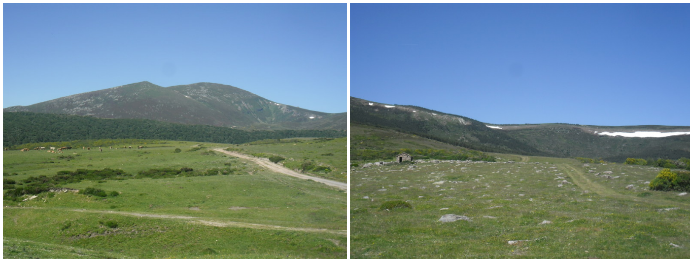
Camino nada más salir de Palombera, con El Pico Liguardi al fondo y a medio plano el Bosque de Bayantún. Zona de Laguíos, con la Cabaña de Ormas y el Sel de Felipe de frente.

un altozano (1323 m). Nada más pasar junto a un refugio del ganado la pradera se cambia por el brezo y se comienza una bajada, aunque enseguida se vuelve a subir, y se atraviesa el arroyo del Barranco de la Hachas (1328 m), que ha formado la llamada Cuenca de Soto, llevando sus aguas a este pueblo. A partir de aquí se entra en la zona de La Cotorra, que está cubierta por el denso Bosque de Bayantún.