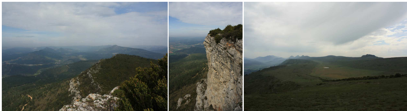
Vistas del Valle de la Bureba desde el borde O de la Mesa de Oña. Detalle del cortado. Depresión de La Laguna, con la poza residual; a la izquierda de ésta se encuentra el Portillo del Mercado.

Lo normal es que si alguien pone un buzón en las montañas lo haga en su punto más alto, sin embargo en ésta lo han puesto en el extremo O del farallón, 15 m más bajo que el punto más alto de la meseta. Además, hay dos buzones muy peculiares, una vieja olla a presión y una especie de refugio o caseta.