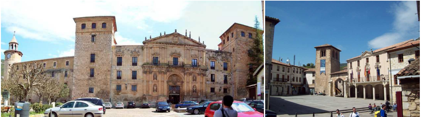
Oña: Monasterio de San Salvador y Plaza del Ayuntamiento.

En esta villa, bañada por el río Oca, está ubicado el monasterio de San Salvador de Oña, una de las más importantes abadías españolas. Fundado en el año 1011 por el conde Sancho García (dicen que para el retiro de su hija Tigridia), llegó a ser el convento más poderoso de toda Castilla, estando bajo su protección más de 200 villas desde el Mar Cantábrico hasta el Arlanzón y desde el Pisuerga hasta las provincias de Zaragoza y Huesca. Los reyes le concedieron mucho poder, tanto en materia fiscal y judicial, como militar. Como curiosidad, la tradición señala que los Pasiegos eran, en origen, pastores del monasterio de Oña.