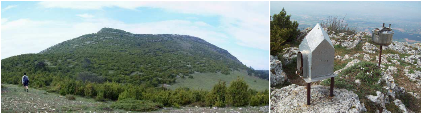
La Mesa de Oña desde el Collado. Buzones en el extremo O del farallón.

Más arriba, se llega a una salida de la pista (830 m) (izquierda, O-NO), donde se tomará este ramal, en el que el ascenso se dulcifica. El camino discurre entre amplios zigzags, subiendo por un terreno de monte bajo, para alcanzar el Corral del Prado (1058 m), donde se conecta con el Camino de la Sierra. Aquí se seguirá por el ramal de la izquierda (SE), que después de una bajada, para salvar una amplia vaguada, sube a un collado (1096 m), formado por la Mesa de Oña (SO) y Los Cuchillos (NE). En este tramo de subida existe un atajo, pero es más recomendable hacerla por el zigzag de la pista, ya que la pendiente es más llevadera.