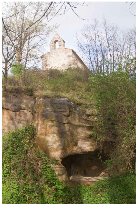
Sobrepeña: Ermita de Santa María de Entrepuerta y cueva artificial eremítica.

Nada más pasar el puente se toma un camino que sale a la izquierda y enseguida llega al caserío de Rebollar de Ebro (717 m). El topónimo significa el “asentamiento en el bosque de rebollos junto al Ebro”. El rebollo, melojo o tocío es una especie concreta de roble, el Quercus pyrenaica, con amplia representación en Valderredible, aunque en la tradición popular no es raro que se asocie el nombre con otras dos especies mayores de robles, el albar (Quercus petraea) y el común (Quercus Robur). Además de restos de antiguas viviendas, en el promontorio de arenisca del lugar se puede contemplar la ermita de Santa María de Entrepuerta (con claros vestigios románicos), así como una pequeña necrópolis rupestre y una cueva artificial o habitáculo que probablemente tuviese una función eremítica.