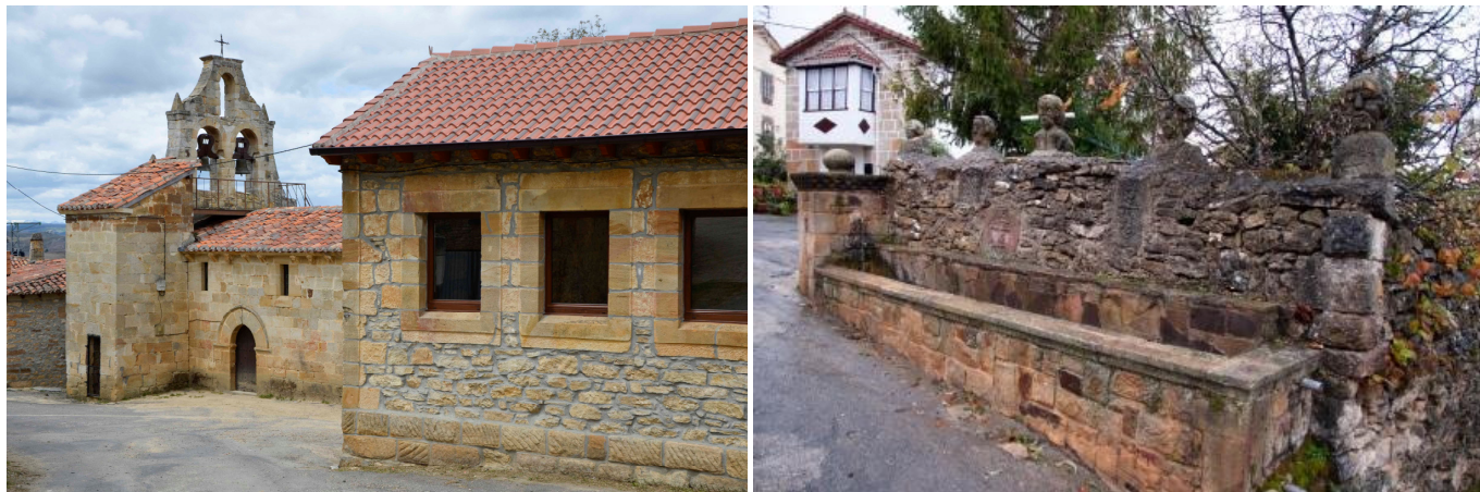
Montecillo: Iglesia de San Marcos y fuente en el centro del pueblo.

tardío, entre finales del XII y comienzos del XIII, es un bello ejemplo de la arquitectura religiosa popular de este período. Posee una sola nave, ábside cuadrangular y espadaña en el hastial (reformada en el s. XVIII). Pero tal vez sea la iconografía mostrada en los canecillos del muro sur el rasgo más sobresaliente, ya que se compone de una interesante muestra de figuras humanas, animales, frutos y el emblema jacobeo de la concha del peregrino.