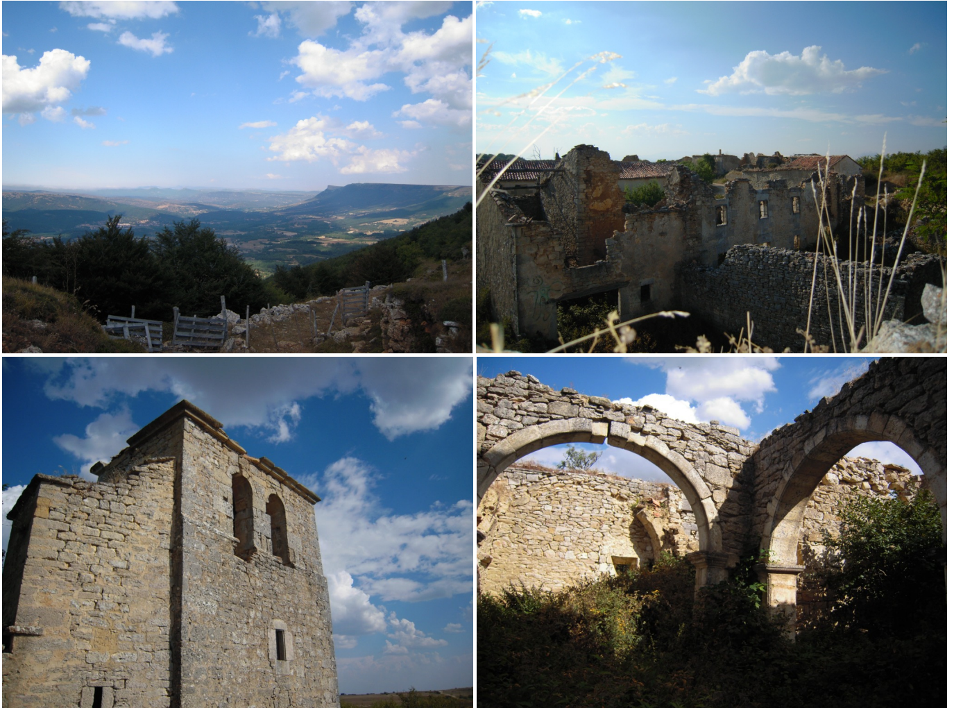
Lorilla: Vista de Valderredible desde el Balcón de la Lora. El pueblo desde el campanario. Torre de la Iglesia y restos de sus estructura.

hasta la salida de humos en el otro extremo de la casa. Se alimentaba con paja y pequeñas ramas, que dieran mucha llama, con lo que los humos iban dejando su calor a medida que recorrían todas las estancias. En esta época aún había una casa totalmente en pie y amueblada y en ella se quedaba unas familias gitanas que venían a ayudar al agricultor que lleva ahora estas tierras. Se decía que en vez de ayudarlo a recoger las patatas lo que hacían era robárselas, así que a finales de esta década “casualmente” se quemó esta casa cuando no había nadie en ella, lo cierto es que no se ha vuelto a ver a estos “avispados cosechadores” por allí.