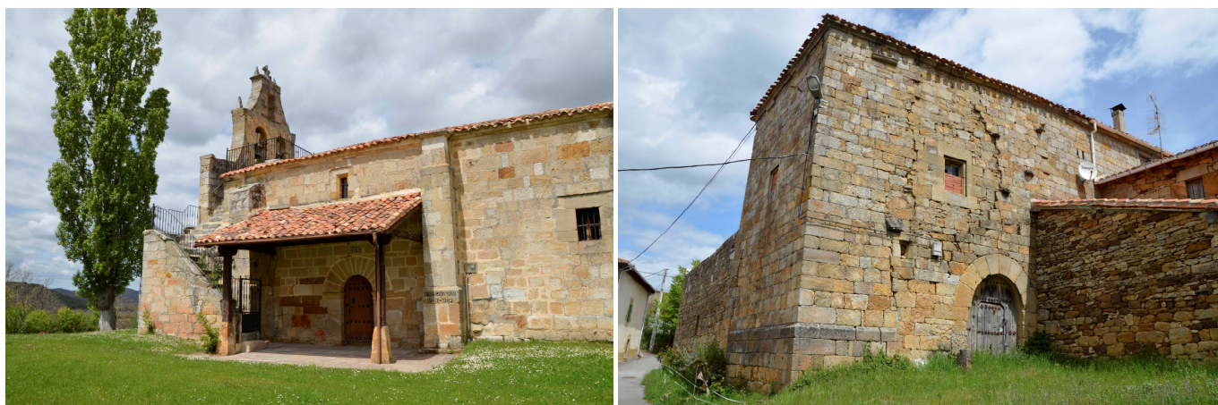
Sobrepeña: Iglesia de Santa Juliana y torre fuerte.

La carretera llanea por un trecho, para virar al N hasta llegar a Sobrepeña (753 m). Como su nombre indica, Sobrepeña está situada sobre un acantilado de arenisca que sobrevuela la margen derecha del río Ebro. Su caserío, bien ordenado, ocupa el solar de un probable antiguo castro sobre el que posteriormente se asentó la torre fuerte (bastante deteriorada), que puede contemplarse en el centro del actual pueblo. Su iglesia parroquial está advocada a Santa Juliana, de estilo barroco del siglo XVII, con interesantes retablos del XVIII.