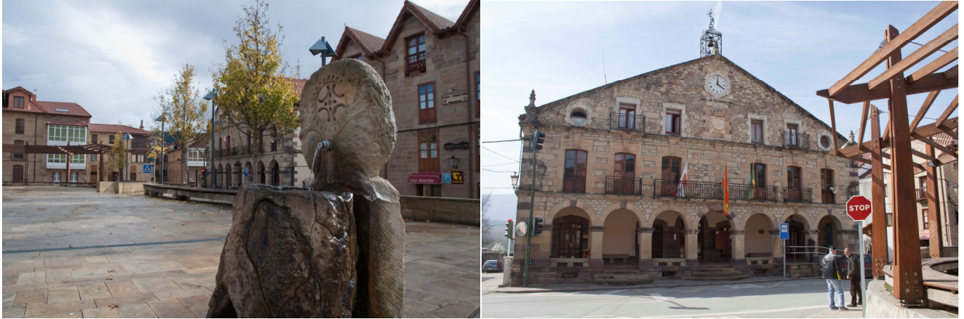
Polientes: Plaza de la Olmeda y Ayuntamiento de Valderredible.

edificio del Ayuntamiento (del año 1906, destacando la arquería de su soportal, las molduras de los dinteles y el remate en hierro forjado de su tejado).