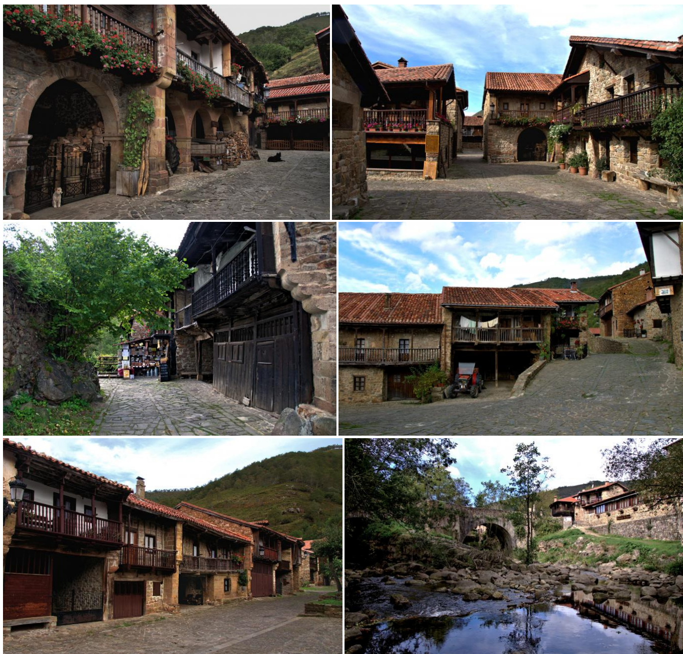
Bellas estampas de Bárcena Mayor.

Bárcena Mayor (502 m), que está situada a orillas del río Argoza, en pleno corazón de la Reserva Nacional del Saja, es el mejor compendio y más bello exponente de la arquitectura rural popular de Cantabria. El nombre de Bárcena es antiquísimo, de origen preindoeuropeo, que aproximadamente significa recodo pequeño, llano y cultivable formado por un río. El pueblo, que fue declarado conjunto histórico artístico en 1979, conserva aún el ambiente típico de su remoto origen. Situado entre montañas y en zona de tránsito entre el valle y la meseta, todavía quedan restos de la antigua calzada romana, aunque los primeros datos históricos se remontan a la Edad Media.