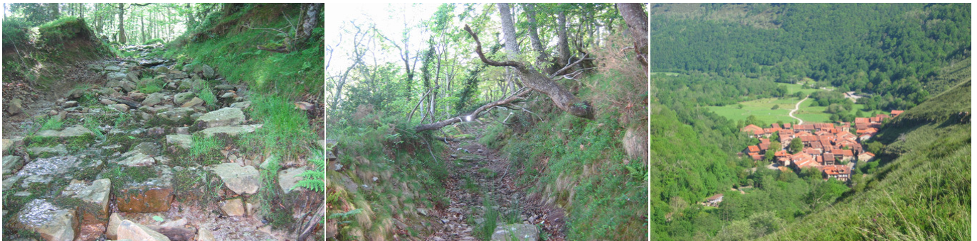
Mal estado del camino dentro del hayedo. Bárcena mayor desde el último tramo de bajada.

Se vuelve por el camino de llegada, pero al alcanzar el collado (1015 m), donde se había tomado esta pista, se continúa de frente, bajando hasta la siguiente collada (987 m) y continuando otros 300 m por la pista, dejando ésta para tomar, por la derecha (S-SO), el camino viejo de Bárcena Mayor a Moral, que baja suavemente hasta alcanzar el collado (951 m) formado entre el Alto de La Guarda (1085 m, al SE) y el de Las Colladas (988 m). Desde este collado se tienen unas excelentes vistas de los Picos de Europa (O). También en esta dirección, pero abajo, se ven los pueblos de Los Tojos y Colsa.