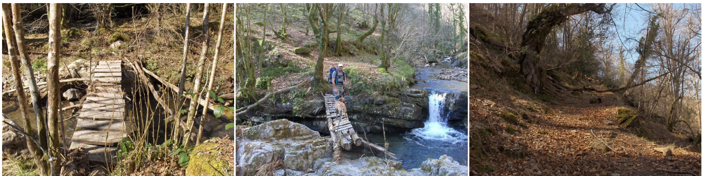
Puente sobre el Arroyo Maza. Puente sobre el Arroyo de Las Cortes. Primer tramo de La Vargona.

Aquí es donde se deja al Río de Los Llares, que baja de las vaguadas del Pico Obios (1222 m), para continuar por la margen izquierda de su afluente el Arroyo de las Cortes, siempre bajo la sombra de los bosquetes que flanquean esta vereda (avellanos, fresnos, espinos, manzanos silvestres, quejigos, etc.). Dada la abundancia de agua en estos alrededores, la cambera puede encontrarse embarrada en varios puntos.