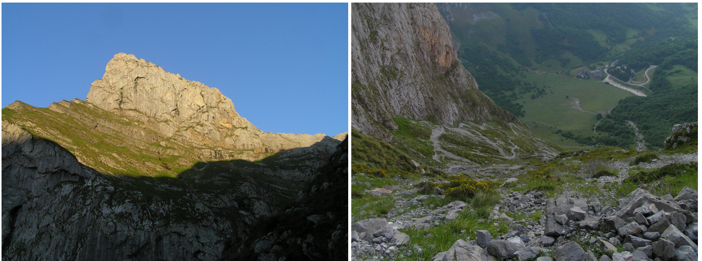
Peña Remoña desde los Tornos de Liordes.

Desde el aparcamiento del teleférico de Fuente Dé (1078 m), se baja al fondo del circo glaciar para dirigirse (NO) hacia el bosque que cubre la zona de Las Molinas y coger la pista que asciende por la parte inferior de la Canal de Mediodía. En este primer tramo coincide con las subidas al mirador de El Cable (la de la Canal de la Jenduda y la del Butrón, cuya bifurcación está más adelante). En la primera gran revuelta se toma el camino de la izquierda, iniciando la subida a la Canal del Embudo, más conocida como Los Tornos de Liordes.