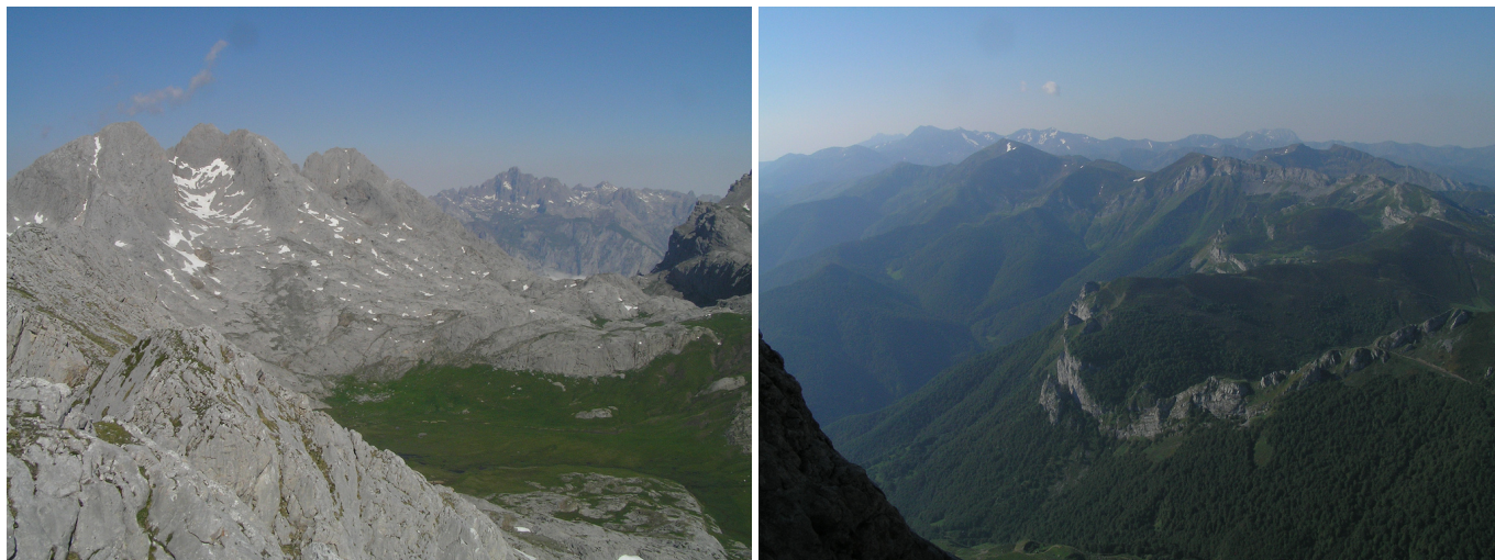
Vistas desde Peña Remoña: Vega de Liordes, con los picos que la rodean por el SO, Torre de Salinas, Torre de Liordes y Torre de Friero con Peña Santa de Castilla al fondo. Zona del Corisco.

La bajada se hará por el mismo camino hasta el collado, donde se irá a la izquierda. El camino baja a la Vega de Liordes por la ladera S de La Padiorna (2314 m), dejando a la izquierda y abajo la Fuente de Liordes, para continuar rodeándola por su zona NO, pero sin bajar al fondo de la vega. La Vega de Liordes (1868 m, en su punto más bajo), es una bonita pradera con abundante agua, cuyo origen se debe a que en su día fue la cubeta de un lago glacial (poljé), que al secarse dejó un suelo donde crece sin dificultad un buen pasto para el ganado. Hacia julio, la vega se llena de flores, lo que ensalza aún más su hermosura.