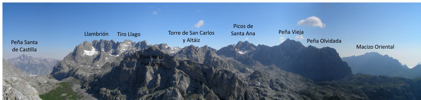
El Macizo Central de los Picos de Europa desde Peña Remoña.

La ascensión a Peña Remoña se puede hacer desde este collado por la larga vertiente norte de este pico, pero es aconsejable, desde el collado, comenzar la subida por la cara que da a la Vega (SO) por una pequeña canaluca, poco después de la cual se virará al SE. En el camino hay que superar bloques de piedra caliza y algún que otro resalte rocoso en el que hay que ayudarse con las manos. La subida es un poco más larga de lo que a primera vista pueda parecer, pero se termina por alcanzar la airosa cumbre de Peña Remoña (2239 m), espectacular proa del submacizo de las Peñas de Cifuentes (la cima más al S y más alta de los tres picos que lo conforman). Las vistas de la Cordillera Cantábrica (S) son amplísimas, pero hacia los Picos de Europa decepcionan algo, pues las paredes del Pico La Padiorna (2314 m) y otros próximos ocultan bastante el resto del macizo.