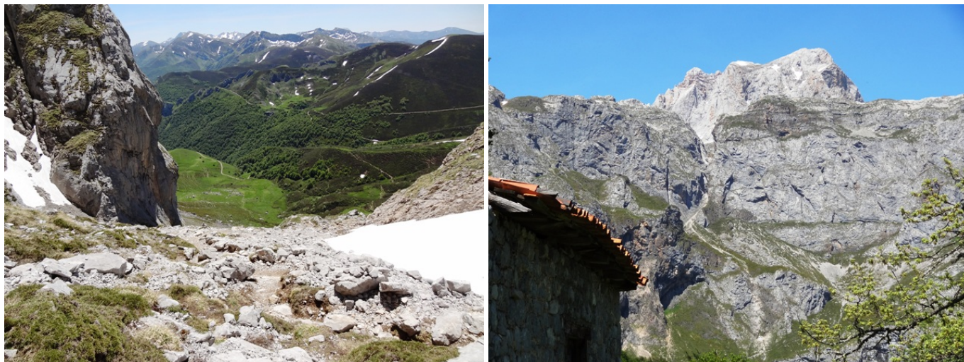
Canal de Pedavejo y zona del Corisco. Vista de la Canal de La Jenduda y la mole de Peña Vieja, desde los Invernales de las Berrugas.

Una vez alcanzado el Collado de Remoña o Alto de la Canal (2035 m), se bajará por la pedregosa Canal de Pedabejo (es imprescindible tener cuidado para no hacer rodar las piedras ladera abajo, con lo que se podría herir a otro montañero). Al principio el camino es un zigzag que se dirige hacia el S, para pronto girar al SO, hacia el Collado de Valdeón por el camino excavado en una pared rocosa, denominado Sedo de Remoña. Sin embargo, enseguida se tomará un camino a la izquierda (SE) que se dirige directamente a la Majada de Pedabejo (1677 m) (en el mapa pone Majada de Remoña), sita bajo el Alto de la Canal, en la que hay una cabaña y el camino gira al E.