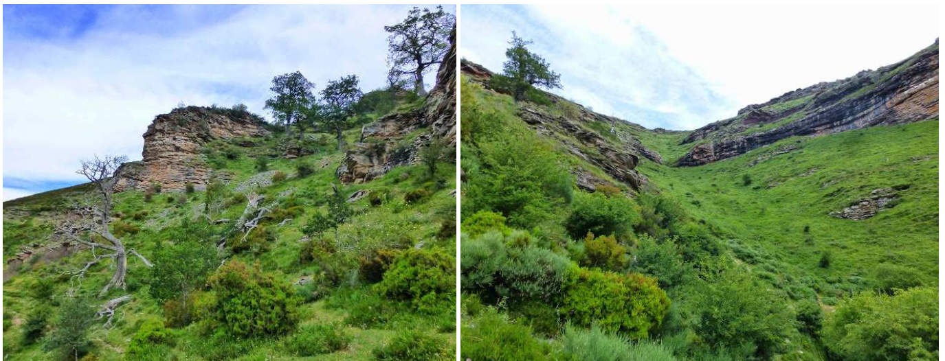
Grandes rocas bajo el Cerro de Juan Fría. Canal del Vallejo, debajo de la cual está Puente Dé.

Una vez en la carretera se seguirá subiendo hasta poco antes del km 17, justo frente a un aparcamiento que hay a la derecha de la carretera se tomará una pista que sale al SO y recorre la ladera S de Peña Aguda (1357 m), prácticamente llaneando, aunque con ligeras subidas y bajadas. De frente, se verá la bonita Canal de Gulatraba.