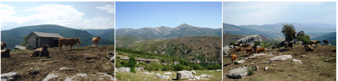
El Portillo: Cabaña. Vistas de Pico Cordel y Peña Hiján (centro). Vista de Campoo.

Finalmente se llegará a El Portillo (1446 m), punto más alto del recorrido, donde hay una cabaña en bastante buen estado. Desde aquí se pueden contemplar unas bellas panorámicas de la Sierra de Cordel (de frente, N) y de todo Campoo de Suso.