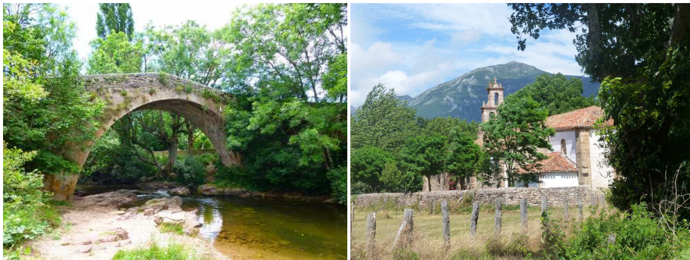
Puente de Riaño. Ermita de la Virgen de Labra, con Pico Cordel de fondo.

En Riaño existen poco más de media docena de edificios construidos con un destino turístico y hostelero. Sin embargo, es muy famoso un antiguo puente sobre el Híjar que popularmente se considera romano, aunque sea en realidad una obra del siglo XVI o incluso posterior. Consta de un solo tramo con ojo semicircular de sillaría de 12 metros de luz y una altura de 6 metros. En 2002 fue declarado Bien de Interés Local. Tiene las mismas características que otro de proporciones más pequeñas que atraviesa el río Guares a poca distancia de éste.