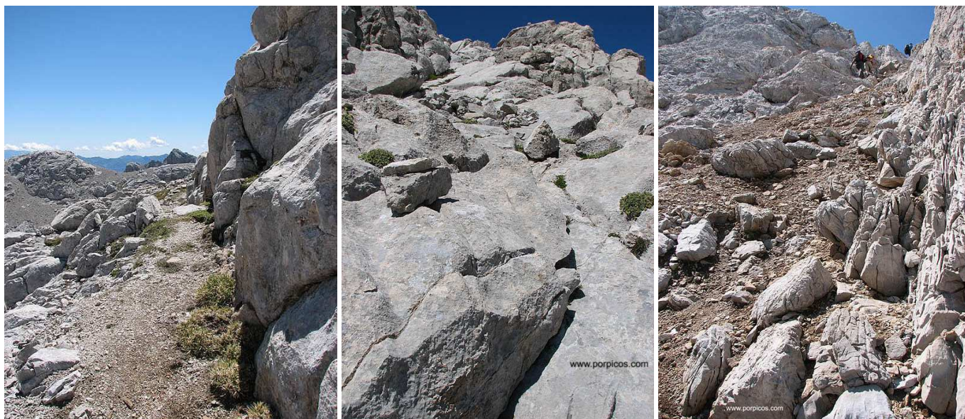
Camino después de Collada Blanca. Canalillo que hay que subir, al NO, nada más acabar el paso anterior. Canal para subir a la arista de Torre Blanca.

(SE) con los picos Tiro Largo (2561 m) y Madejuno 2509 m). De este cordal, desde Torre Blanca se desprende una arista que llega hasta esta collada, aunque este pico no se ve al estar tapado por el contrafuerte que cae hasta el collado.