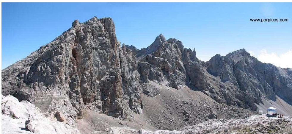
Vistas desde el camino de vuelta: Cabaña Verónica, con el fondo de Torre de Horcados Rojos, Pico Santa Ana y Peña Vieja

En este punto, la ladera de la vertiente de Traslambrión presenta 200 m de caída casi vertical, aunque la ladera hacia Hoyos Sengros es más suave. A partir de aquí sólo queda subir el tramo final por la cresta (SO), que ofrece algunos resaltes con trepada antes de alcanzar la cumbre de Torre Blanca (2617 m), coronada por dos buzones alpinos. Las vistas son especialmente amplias hacia el S, dominándose el submacizo de las Peñas de Cifuentes tras la depresión de Liordes, así como los montes de Riaño y las cumbres del macizo de Fuentes Carrionas. Por ese lado hay un cortado impresionante.