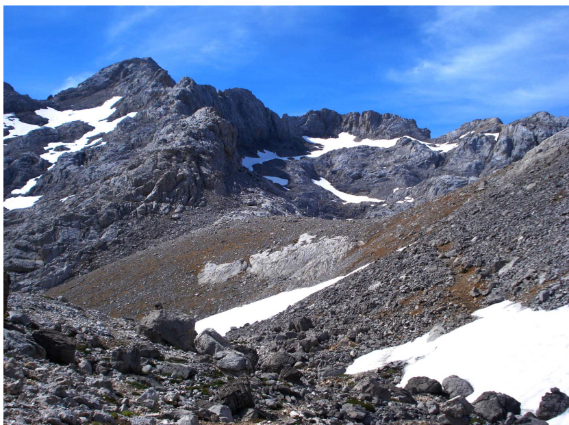
Collada Blanca y arista que termina en Torre Blanca.

Desde allí se continúa (O-NO) subiendo por el espolón sobre el que se asienta el refugio hasta su punto más alto (2367 m), para bajar a la derecha a un collado (2357 m), que une la cota anterior con el Pico Tesorero. En este tramo la senda es bastante difusa y los hitos que jalonan el camino son de gran ayuda. A partir de ahora, sin embargo, el camino es algo más evidente, rodeando por el N (derecha) la gran hoyada de Hoyos Sengros (2273 m, en su punto más bajo). En este tramo el camino discurre predominantemente plano, aunque con continuas subidas y bajadas, hasta alcanzar Collada Blanca (2372 m), también conocida como Garganta del Hoyo Grande.