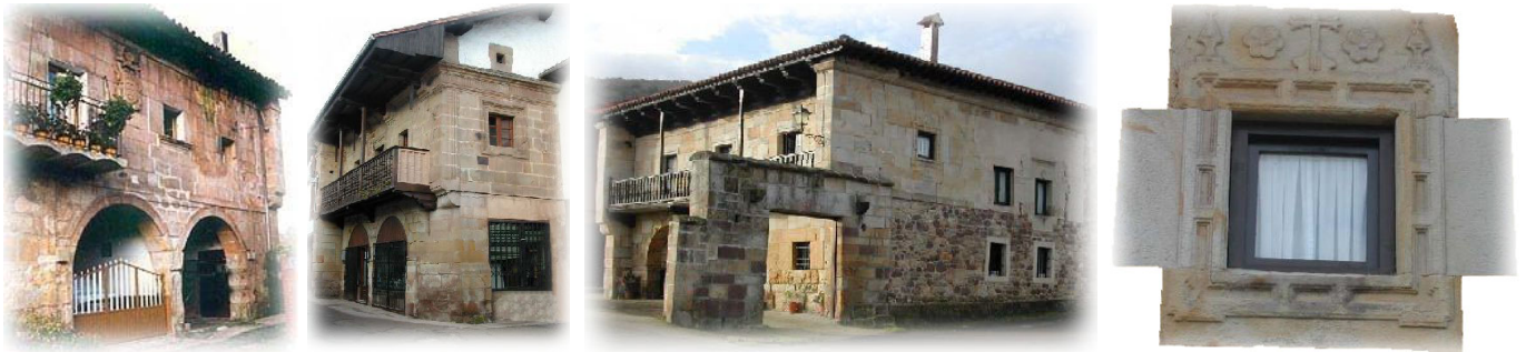
Casonas de Coo: de Melchor, Solariega, de Ceballos con detalle de la ventana.