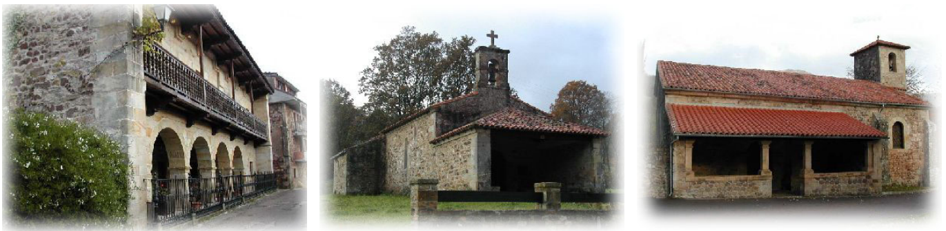
Otra casona montañesa, Iglesia Parroquial de San Martín, ermita de Los Remedios.