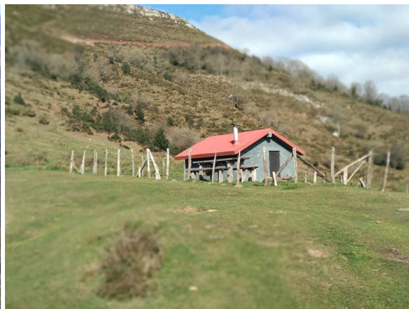
Vistas desde el Pico El Acebo: En primer término, las campos del Campo de la Cruz y en el centro el alto de la Garita Collado. Cabaña de El Salce, a los pies del Pico El Acebo.

Unos metros más adelante se desechará un camino a derecha, pero un poco más adelante se encontrará una bifurcación, siguiendo por el ramal derecho, porque el izquierdo sólo va a unos caseríos. Siguiendo por el camino principal, que discurre entre prados, se llega a una curva a la izquierda, que el camino da para librar una loma con fuerte pendiente, en la que hay un eucaliptal. Enseguida se pasa junto a un caserío e inmediatamente se cruza un paso canadiense, momento en el que se dejará el Camino de Mazcuerras a Coa, para tomar un camino herboso a la izquierda. Este punto es el comienzo de la Senda del Requeté, que al principio llanea, para enseguida subir suavemente.