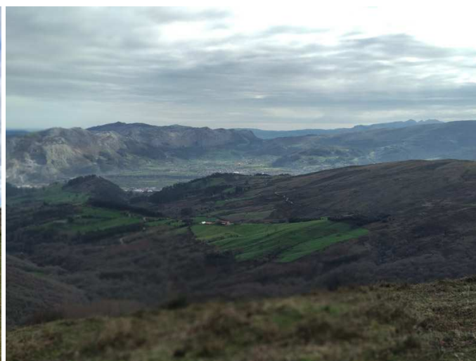
Vistas desde el Campo de la Cruz: Picos Mozagro (izquierda) y Acebo. Vistas del Valle de Buelna, con el cordal del Dobra y el Pico de la Capía.

El camino es amplio hasta pasar una cuadra (derecha), pero a partir de aquí se convierte en una senda que discurre entre monte bajo, para más adelante entrar en un bosque de hayas. Inmediatamente se cruza un regato y, enseguida, el Arroyo Mortera. A partir de aquí la pendiente