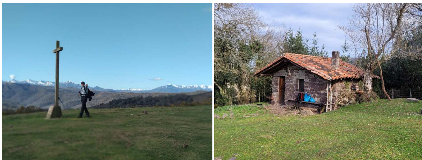
La cruz del Campo de la Cruz, con lo picos de Campoo a la izquierda y los de Peña Sagra a la derecha. Cabaña de Las Estranguadías.

Desde esta cima se contemplan unas magníficas vistas de Santander, los montes del sur de la bahía, la zona de Laredo, Santoña, de los Valles de Cieza y Buelna, además de las principales cimas de Cantabria.