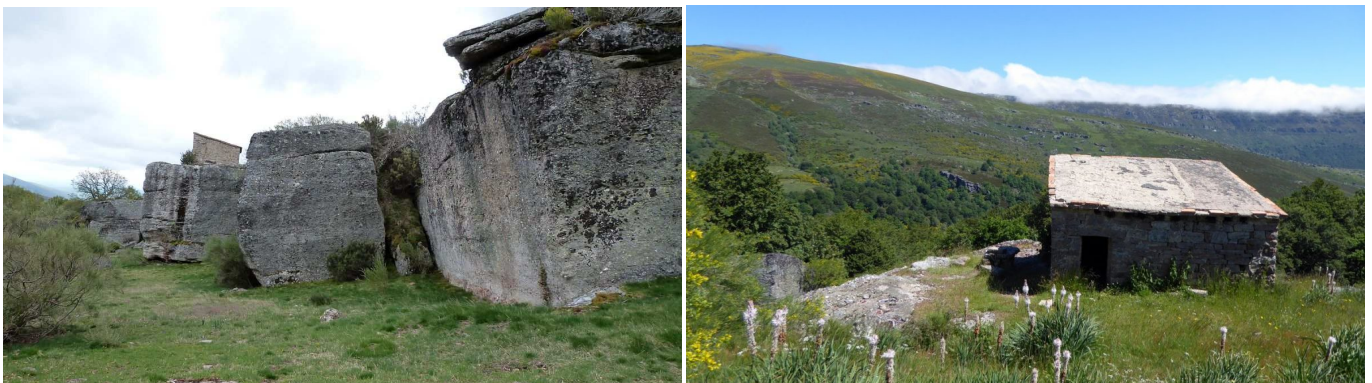
Chozo de las Mesucas visto desde dos lados. En la segunda foto se puede ver el Monte Calar.

Se continúa subiendo, con una pendiente más fuerte que la anterior, por un terreno despejado, sin camino marcado. Al final, se da a una pista, justo donde hay una trifurcación (1363 m) y se encuentra la Fuente de San Bernabé. Se seguirá por el camino que sale de frente, que sube ligeramente al principio, para introducirse en el Monte Calar y llanear (prácticamente) durante un buen trecho.