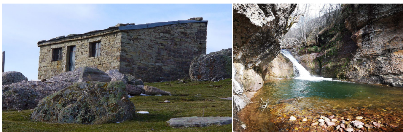
Chozo de Mostajuelo y Pozo Merino.

Se continuará en dirección N, por un camino no muy marcado, que a veces se pierde, aunque enseguida va virando al O hasta alcanzar una zona de roca cuarteada por grandes grietas. Junto a estas rocas se podrá ver una rueda de molino. Se continúa subiendo en dirección O, justo por la zona despejada al borde del arbolado, para llegar al Chozo de las Mesucas (1571 m), que se encuentra sobre unas grandes piedras, dominando una gran extensión de terreno en el que pastaba el ganado. Es fácil ver venados y corzos por allí, y, aunque menos frecuente, también se pueden encontrar rastros del paso del oso pardo. El bosque que hay debajo del chozo es espectacular.