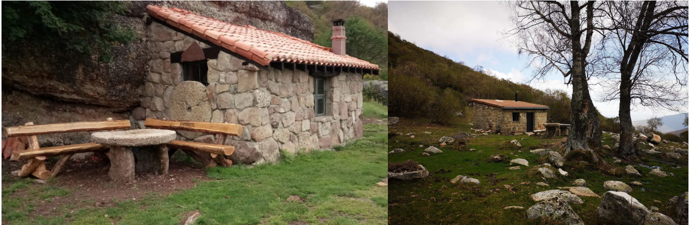
Chozo del Prao del Toro y Chozo de El Cerezo.

El camino asfaltado sube un poco para inmediatamente bajar a cruzar (1185 m) el Río Rubagón, que nace en la falda SO del Pico Valdecebollas. Inmediatamente, la pista da una curva a la izquierda, comienza a subir, y 80 m después otra a la derecha. Justo debajo de ésta, en el río se encuentra el Pozo de la Aceña.