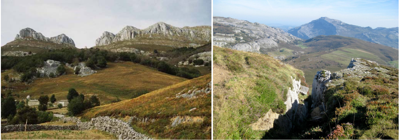
Cordal de Peña Lusa desde las Cabañas de Lusa. Portillo de las Escalerucas.

El punto de partida es el aparcamiento (1120 m), que han construido en el Km 4,8 de la carretera que desde el Río Trueba sube al Portillo de Lunada (o de La Hoz). En la parte inferior se encuentra el Barranco de Trasmánueva, donde se ubican las Cabañas de La Lusa. Se toma una serpenteante pista, hacia el E (derecha según se mira hacia el Portillo de Lunada), cuyas curvas hacen que su pendiente sea llevadera. Al principio, el terreno está cubierto de cortos brezos, pero enseguida se entra en un bosque de hayas, no muy cerrado, que salen por entre grandes y diseminados pedruscos.