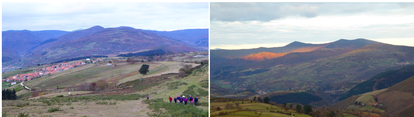
Bostronizo desde el Cotero de la Lomba, y de frente el Pico Gedo. Valle de Cieza visto desde Coturias, con el alto de La Garita (derecha), a continuación, los Picos de El Acebo, Mozagro y Alto del Toral.

La marcha continúa bajando por el pernal N-NE hasta el Collado Coturias (598 m), para continuar por este cordal subiendo al Campuzo de los Prados (631 m) y bajando a una collada (621 m). El siguiente alto de Coturias (729 m) se rodeará, dejándolo a la izquierda alcanzando una collada (711 m), subiendo a continuación a La Garmía (761 m), punto más alto del recorrido.