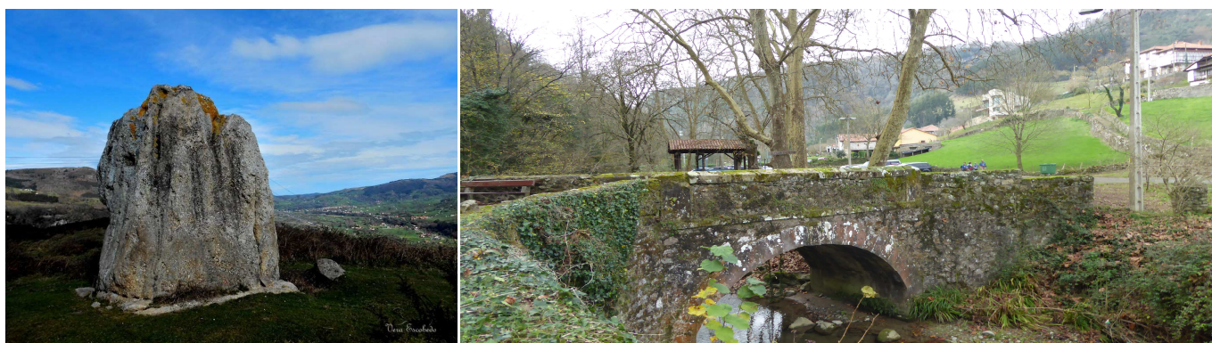
Piedrona de Villegar. Puente de Borleña sobre el Arroyo de la Llana, en la carretera de acceso al pueblo.

Unos 80 m después de tomar esta carretera, nada más pasar el campo de fútbol, se tomará una calleja a la derecha para salir del pueblo por la zona E. Al llegar a la última casa se encuentra una bifurcación, continuando por el ramal de la derecha. Este camino llanea al principio, para después bajar suavemente, pasando por la llanada de La Espinera y continuando (N) por el pernal hasta alcanzar la pista que sube de Villegar de Toranzo.