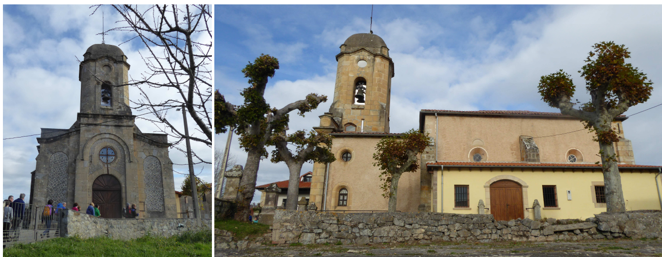
Iglesia de Castillo Pedroso.

Esta zona alta, denominada Campo de Breña, está formada por pequeñas elevaciones de suaves pendientes, por lo que está llena de fincas. Por ello, el camino va haciendo una amplia curva, rodeando todos estos prados hasta tomar el camino de acceso a los mismos (dirección SE) y llegando a una pista, justo debajo de una línea de alta tensión. En este cruce se seguirá a la derecha, bajando al principio, para luego llanear entre los invernales de Matas del Castillo.