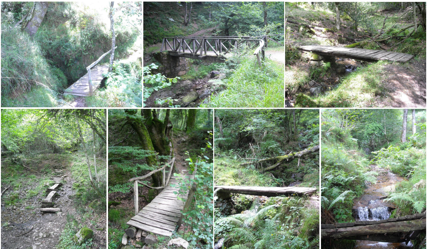
Algunos de los puentes y pasarelas del recorrido.

300 m después se dejan a la izquierda unas fincas con casas, en el paraje conocido como Casa del Tío Mero (280 m). Después de éstas se llega a otra bifurcación, donde se irá a la derecha (a la izquierda discurre el Sendero de Hayacorva PR-S 112). Después de otros 600 m por la margen derecha del Río Bayones se deja éste, que baja por un barranco a la derecha (S) desde su fuente en la falda del Pico Tordías (968 m).