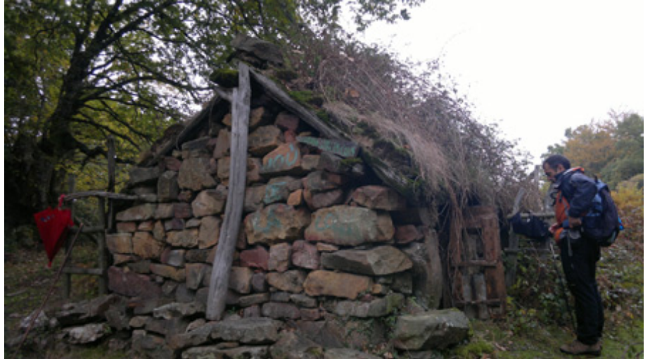
Cabaña del Jou de la Collá.

Unos 250 m después de pasar este caudal se encuentra un indicador que muestra el camino para ver uno de los árboles singulares más interesantes de todo el Monte de los Vados. Se trata del "Roble tumbado de Bujilices" (537 m). Esta cajiga ( Quercus robur L.) tiene el tronco tumbado, de unos 10 metros de longitud sobre el suelo, y se encuentra en muy buen estado de conservación. De este grueso tronco tendido surgen