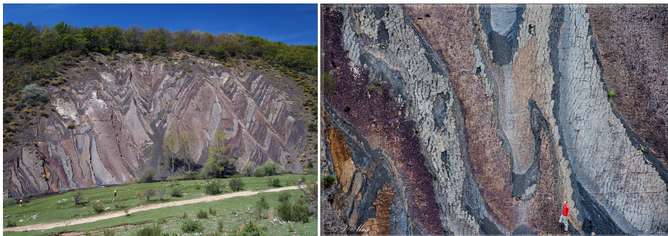
Pared de Ribero Pintado, con el detalle de sus vetas.

Se continúa tomando (izquierda, S-SO) la pista que baja paralela al Arroyo de la Varga, pasando inmediatamente por el puente de madera de la pista y caminar por su margen derecha. Enseguida el rumbo cambia al O-SO llegando después a la vaguada del Arroyo del Lombatero (a la derecha), por la que sube una pista que se desechará siguiendo de frente por la que se trae. Sin embargo, nada más pasar el regato se dejará la pista para tomar un camino entre escobas a la derecha, que enseguida conecta con otra pista en la que se continuará subiendo de frente.