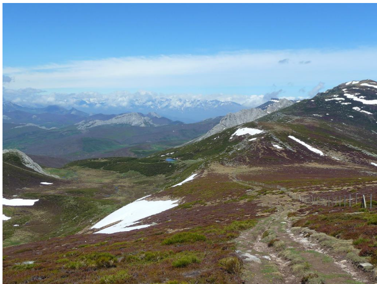
Vista desde el Collado Sestil, con el Collado y la Laguna del Sel de la Fuente (en primer término), el Valle de los Redondos y, al fondo, las montañas del N de Palencia.

En este punto se dejará el camino más marcado, para tomar una senda que llanea al principio, pasando a la derecha de una piedra, para después bajar entre escobas (NO) hasta la Laguna del Sel de la Fuente (1.808 m), que se rodeará dejándola a la izquierda. Se continúa por el camino marcado pasando por encima de la peña donde está la Cueva del Cobre, para