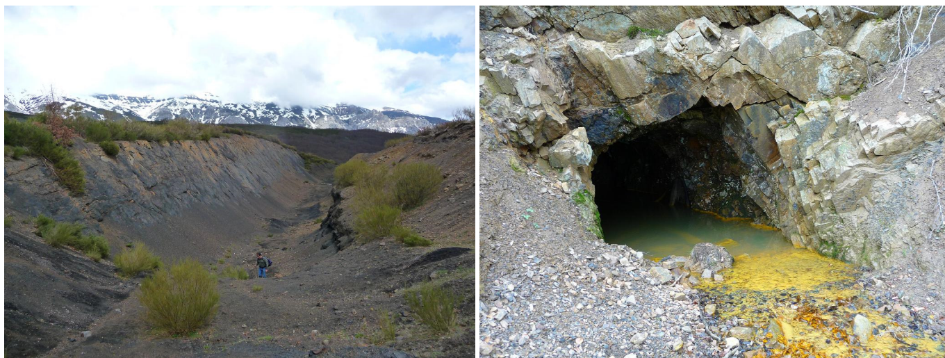
Trinchera de la mina a cielo abierto y una de las bocaminas que se pueden ver en el recorrido.

A la altitud de 1.355 m se llega a una pista más importante, donde se tomará el ramal de la derecha que sube al N-NO. 200 m más adelante se encuentra una bifurcación, donde se irá a la izquierda para casi llanear durante 800 m y alcanzar una mina de carbón a cielo abierto abandonada. Al llegar a la altitud de 1.400 m se dejará la pista para atravesar la mina por la trinchera (1.418 m) que en su día se excavó de E a O.