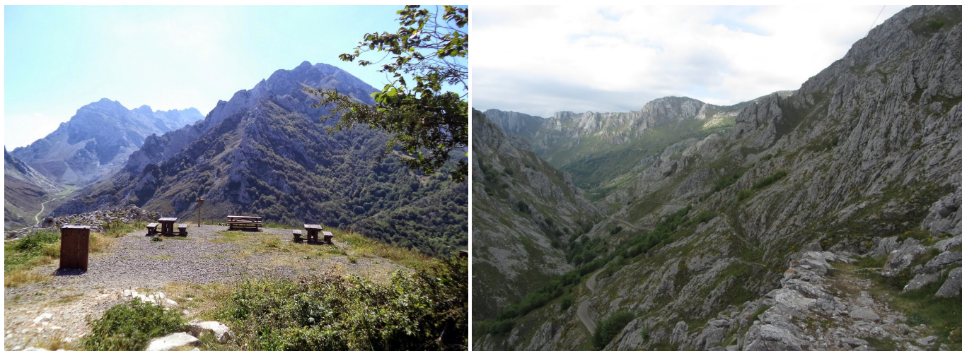
Mirador-Área de Recreo a la salida de Sotres, con las Peñas de Maín de frente y el Valle del Duje (hacia Áliva) con el Escamellao. Camino excavado en la roca hacia Tielve.

Se sube por la carretera hasta Sotres y al llegar a una plaza (1027 m) se sube por la calle que sale a la izquierda hasta llegar a otra plaza superior (1048 m), donde se continuará por la izquierda (O, que va girando al NO), pasando junto a su Iglesia de San Pedro, hasta alcanzar las últimas casas del extremo NO del pueblo, donde se seguirá por el camino que sale a la izquierda.