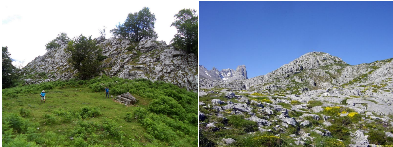
Cueto Vernil desde Collado Vernil. Cabeza la Mesa y Pico Urriellu desde el collado final.

se ve, a la derecha, la cima de Cabeza la Mesa, a la izquierda Cabecina Quemada y de frente el Pico Urriellu y todos los Urrieles.