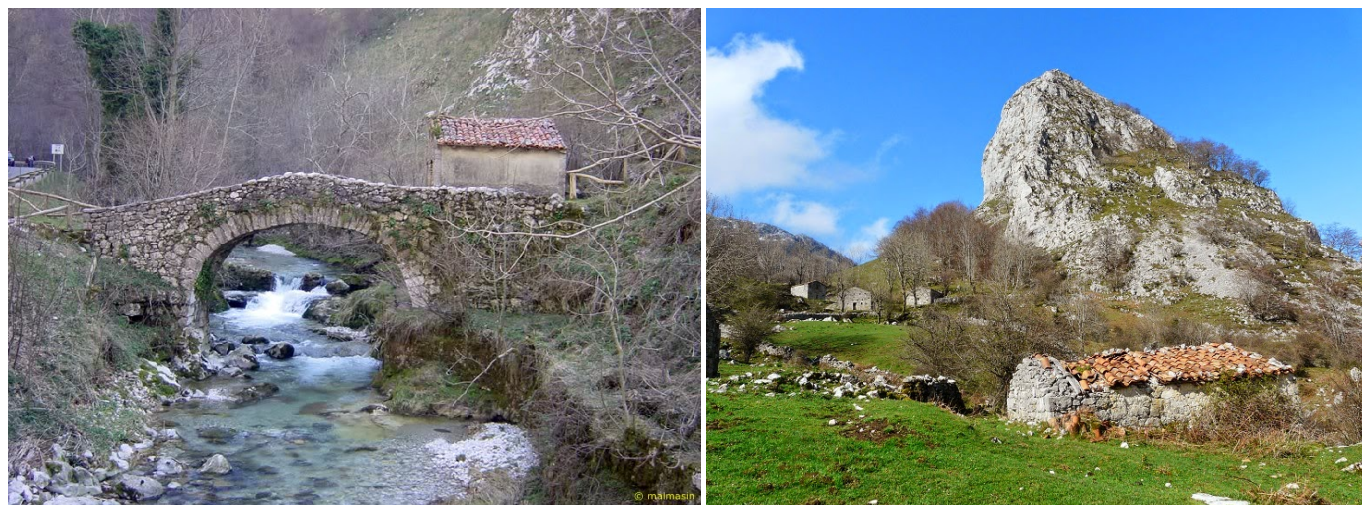
Puente Medieval de Sotres y su molino. Cueto Vierru, con los invernales homónimos.

Al principio la pista está hormigonada, pero pronto se convierte en camino carretero. Este tramo está festonado de invernales. Primero se pasan los de Concha Pardo y a continuación los de Calmor. A partir de éstos la pendiente de la ladera aumenta considerablemente, por lo que para salvarla el camino sube por un hayedo en continuos zigzags. En este tramo, donde las hayas lo permiten, se tendrá de frente la mole del Cueto Vierru.