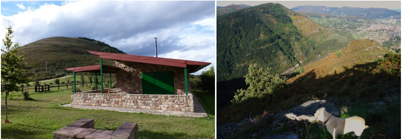
Campo de la Cruz, con el Refugio de Monte Brazo y Cueto Moroso. Vista al N desde Cueto Moroso, con el Monte Gedo y el Valle de Buelna

(877 m) a continuación. En este tramo la tendencia es a subir suavemente, hasta que se mete entre el arbolado, donde comienza un sube y baja hasta alcanzar el afilado pernal N del cueto. En este momento se torcerá a la derecha, para subir por el borde de éste.