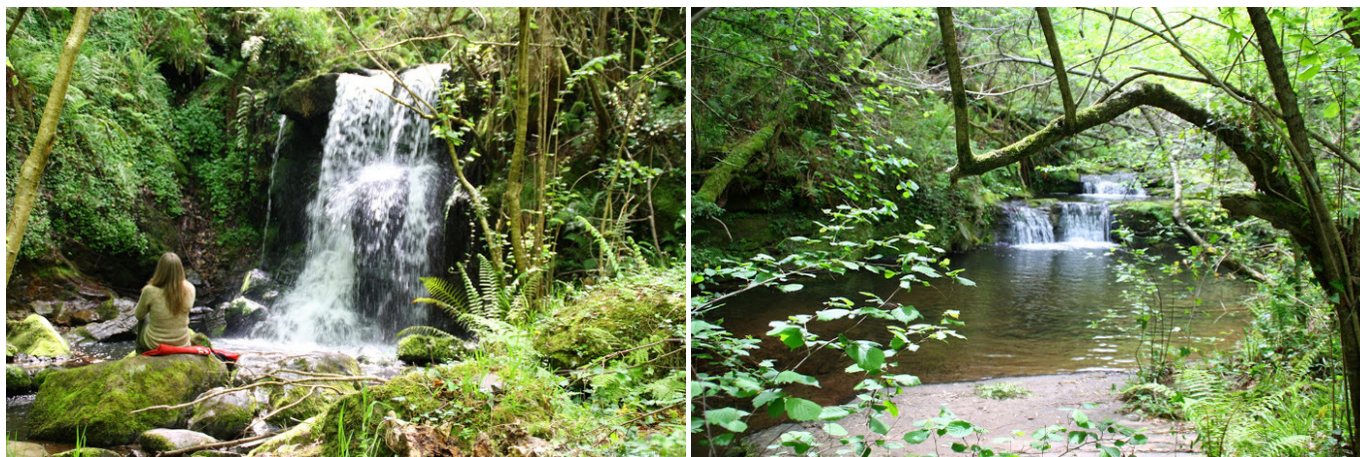
Dos cascadas del sendero fluvial de la Canal de las Tejeras.

y enseguida se encuentra una trifurcación, donde se irá a la izquierda por el camino asfaltado (por el de la derecha se volverá).