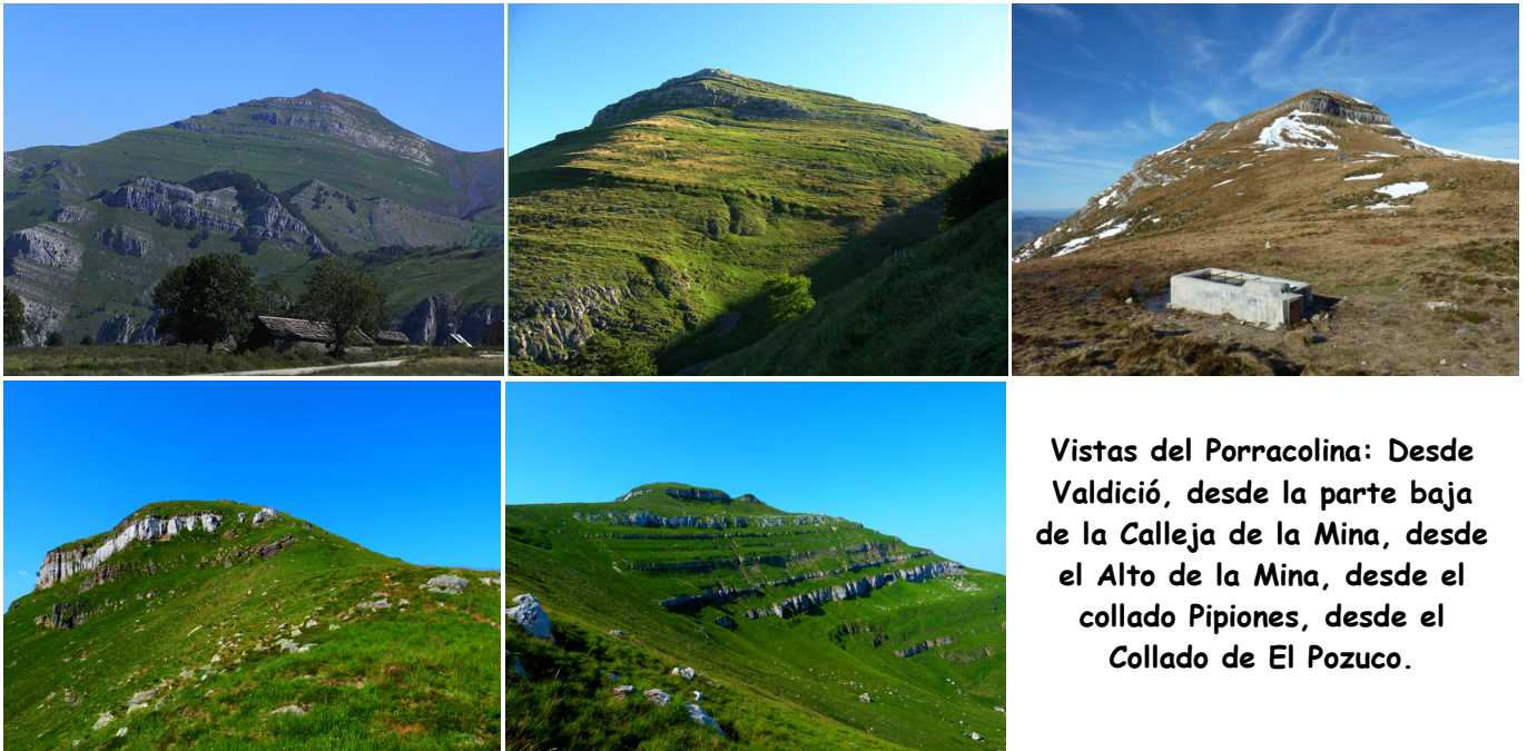
Vistas del Porracolina: Desde Valdició, desde la parte baja de la Calleja de la Mina, desde el Alto de la Mina, desde el collado Pipiones, desde el Collado de El Pozuco.

Ahora se pasa por el diseminado caserío de Calseca y, después de obviar dos salidas a la izquierda (van a casas aisladas de Calseca), unos 700 m después del cruce anterior se deja la carretera (continuando de frente se llega a Bustablado, estando totalmente asfaltada y apta para el paso de coches), para tomar una pista que discurre a la derecha (E) junto al cauce del Arroyo de Calseca.