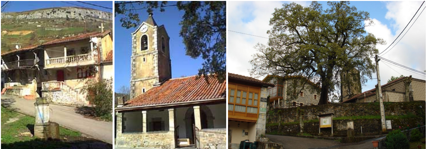
Tres aspectos de Bustablado.

Al entrar en esta zona, el camino va a la izquierda, dejando a la derecha una de estas fincas en la que hay un gran hoyo. A mitad de éste se entra en una pista, que enseguida aboca en la carretera (pista asfaltada) Calseca - Bustablado. Se toma el ramal de la izquierda, donde después de 700 m se llega al Monumento a la Vaca Pasiega en Espinajones (878 m). Aquí se sale de la pista asfaltada por un camino que va a un caserío, que se encuentra abajo a la derecha. En la primera curva se deja ésta para continuar campo a través (dirección N) y comenzar otra bajada por el pernal N del Alto de Porra Hormigas, denominado Sierra de la Mazuela.