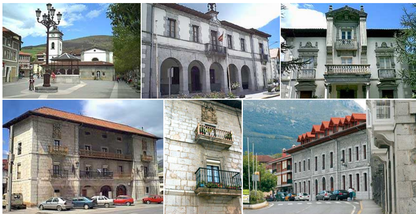
Arquitectura de Rmales: Iglesia de San Pedro y Plaza; Ayuntamiento; Casa de Sarabia; Palacio de Revillagigedo y detalle de balcones y escudo; Biblioteca Juan de Zorrilla San Martín.

La historia de Rmales está centrada en la figura de Baldomero Espartero, el mítico general liberal, que en la primavera de 1839 derrotó al ejército carlista del general Maroto, en la famosa batalla que tuvo lugar en Rmales y Guardamino; la lucha iniciada a primeros de Abril, finalizó el 13 de Mayo al rendir y entregar sus armas los últimos defensores del fuerte y precipitó el final de la primera Guerra Carlista, escenificada mediante la firma de Tratado de Vergara en Agosto de 1839. En conmemoración de estos hechos el pueblo pasó a ser la Villa de Rmales de la Victoria.