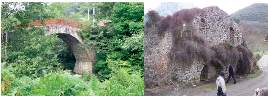
Puente y Ferrería del Salto del Oso.

Después de subir hasta la N-629 se tomará la dirección de la izquierda, llegándose al poco tiempo al centro de Rmales de la Victoria (85 m).