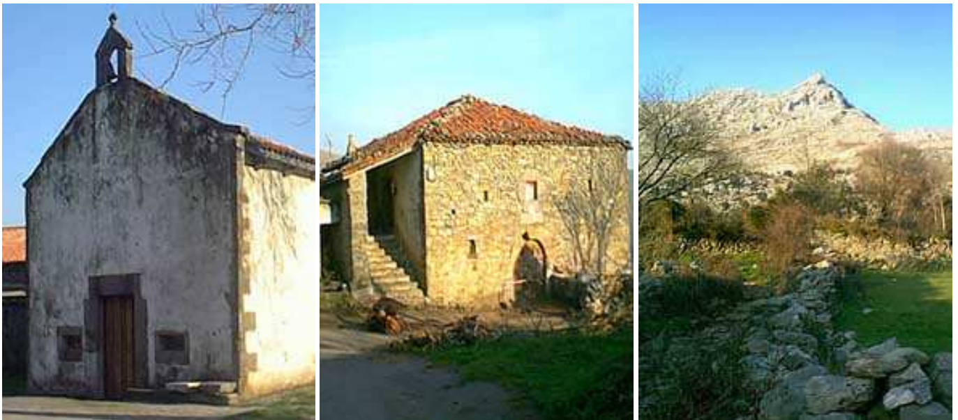
Manzaneda: Ermita de Nuestra Señora del Rosario, casa típica y vista del Pico de San Vicente

Siguiendo por la carretera se llega a Manzaneda (470 m) un pequeño barrio donde termina todo camino rodado. Las vistas desde este enclave son magníficas, destacando, hacia el E, la Peña Busta (719 m), al otro lado del Gándara, con su vertiente meridional (S) muy tendida y las demás escarpadísimas, especialmente la E (que queda al lado opuesto).