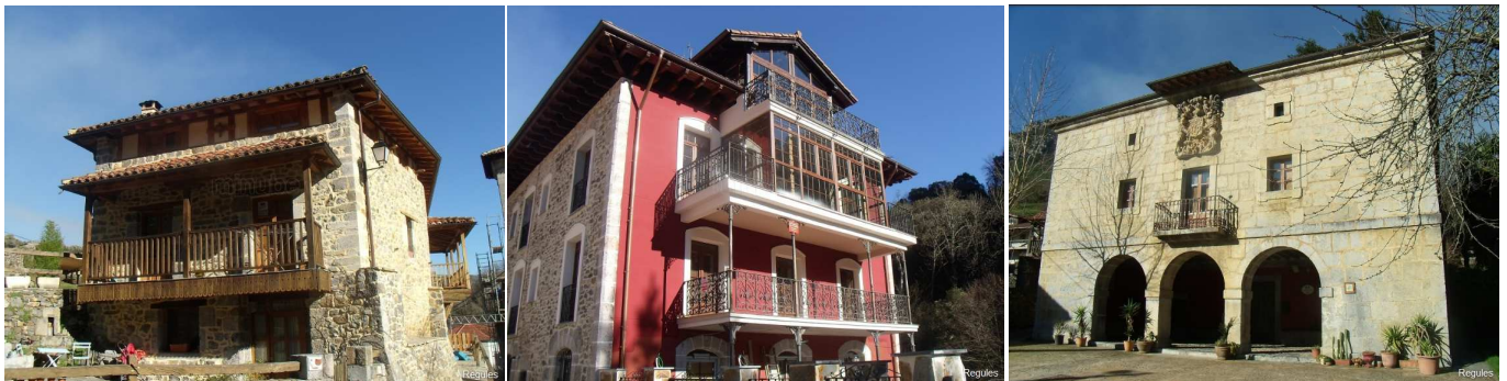
Casonas de Regules, la de la derecha es la de los Martínez del Valle (hoy Posada Rural)

Siete km después de pasar Ramales se llega a la población sobana de Regules, en la que se pueden contemplar algunos bellos ejemplos de arquitectura tradicional, casas con sus galerías acristaladas, las balconadas de madera, las típicas entradas de las casas sobanas llamadas "patín" y algún escudo nobiliario como el de la Casona de los Martínez del Valle. También se puede admirar la iglesia de Santa Eulalia, del s. XVI.