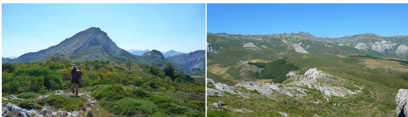
Cumbre de Peña Abismo desde Lombatero, la subida es por la parte izquierda del pequeño cortado central. Pico Tres Mares y Cuchillón, con el camino recorrido, desde la falda de Peña Abismo.

Después de esto, la pendiente se va suavizando paulatinamente y a la altitud de 1615 m se encuentra una llanada, junto a la que se halla el Castro de Zacarriel (1622 m), que se deja a la derecha. Inmediatamente después se llega a una bifurcación, siguiendo por la derecha. El camino de la izquierda da un rodeo por la cabecera del Arroyo Lombatero, bajando por su margen izquierda, para cruzarlo después y terminar en un collado, al que se dirige directamente el camino que se debe seguir.