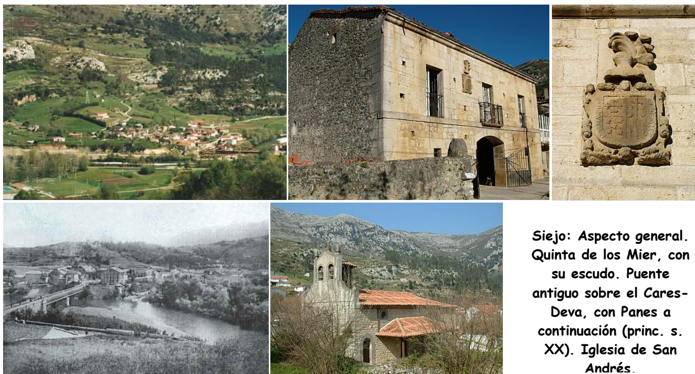
Siejo: Aspecto general. Quinta de los Mier, con su escudo. Puente antiguo sobre el Cares-Deva, con Panes a continuación (princ. s. XX). Iglesia de San Andrés.

Se sale de Alevia por la sinuosa y estrecha carretera, construida con el esfuerzo económico de los emigrantes, que después de 2,5 km de pendientes curvas llega al barrio de Siejo (25 m, junto al río).