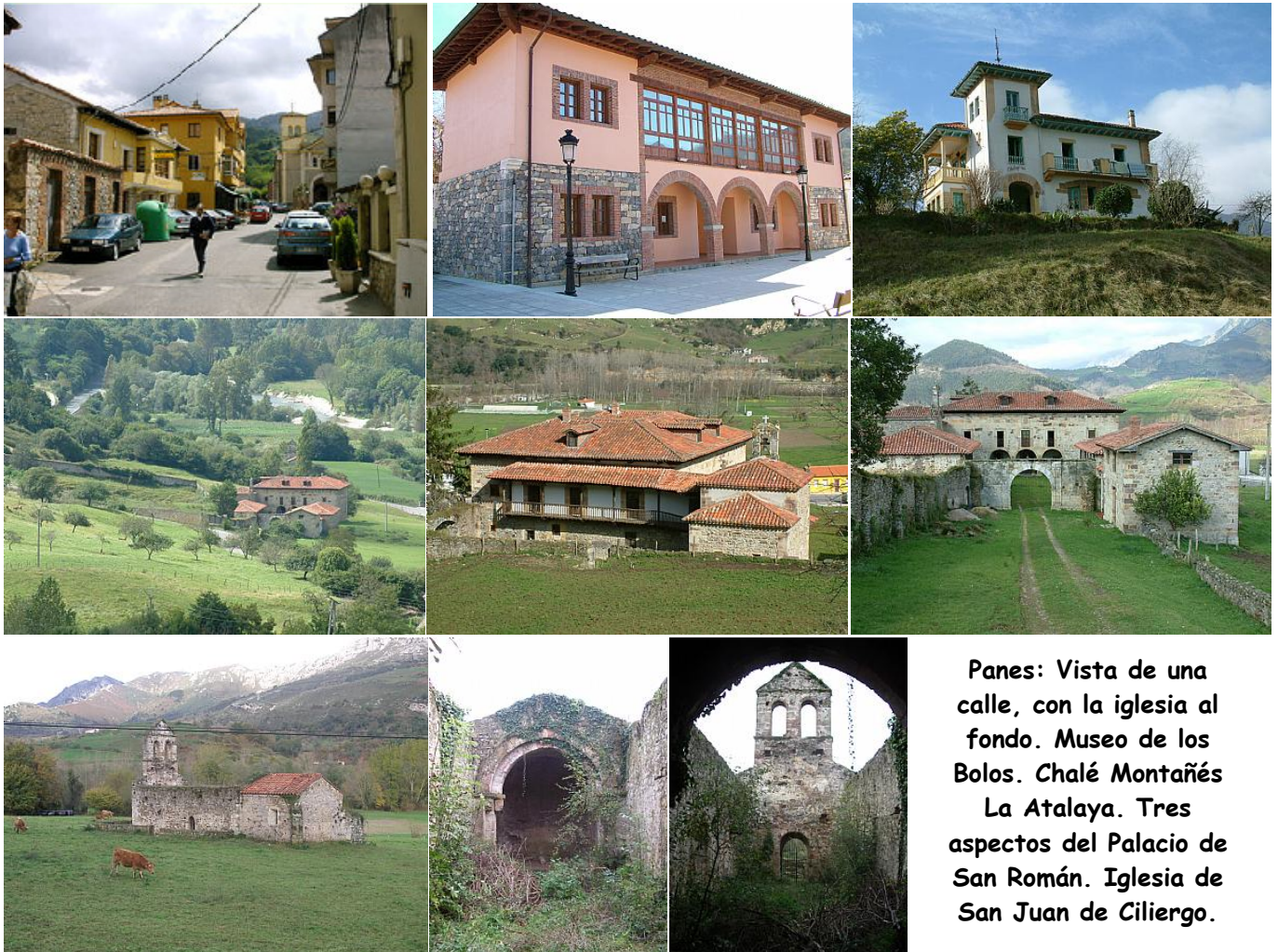
Panes: Vista de una calle, con la iglesia al fondo. Museo de los Bolos. Chalé Montañés La Atalaya. Tres aspectos del Palacio de San Román. Iglesia de San Juan de Ciliengo.

Finalmente, el chalé Montañés La Atalaya que es una vivienda unifamiliar, de los años 1920-1930, exenta, concebida en estilo regionalista en su modalidad montañesa.