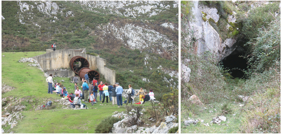
Mina de El Pilar, restos y entrada a la mina

Continuando por la ancha pista y tras pasar un collado (541 m) se sigue subiendo para llegar a las abandonadas instalaciones de las antiguas Minas El Pilar (572 m). Estas minas de hierro y manganeso, cerradas hacia finales de los sesenta, tuvieron bastante actividad, llegando a trabajar, en la época de mayor producción, unos 70 mineros. Todavía pueden observarse los restos de la antigua mina, quedando la caseta del transformador, el depósito del agua y una especie de molinos de tolva, además de los pozos de extracción del mineral que se encuentran sellados. A la derecha de la pista, en la hondonada de la mina, hay un abrevadero y una gran charca.