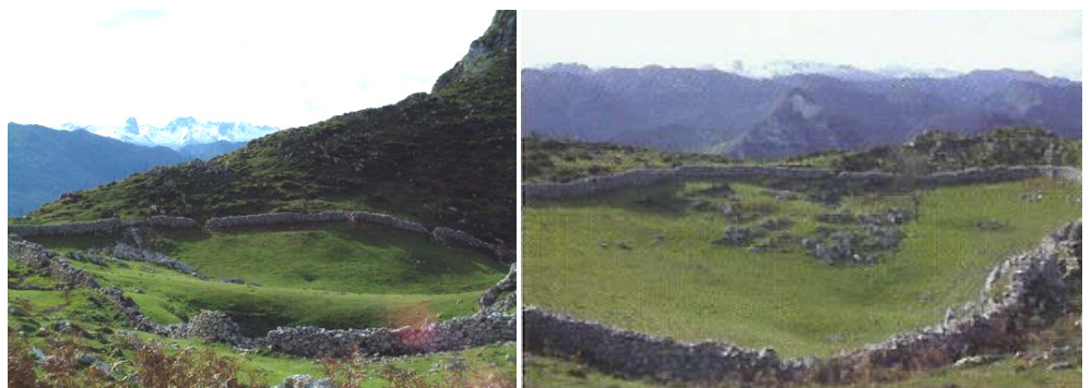
Dos aspectos de la Braña La Pipa, con los Picos y el Naranjo al fondo.

En este mismo lugar conecta por la derecha el camino que se señaló como atajo. Con la referencia de la cumbre, se continúa entre cabañas y se atraviesa el prado de una majada, de las que componen la Braña La Pipa (630-640 m), situada en la base misma del pico.