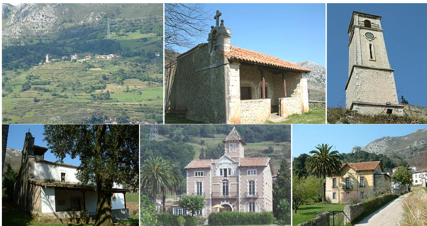
Alevia: Situación en la ladera del pico Llueres. Ermita de San Antonio y su torre exenta (Torre de Alevia). Iglesia de San Juan y Quintas de Arriba y de Abajo