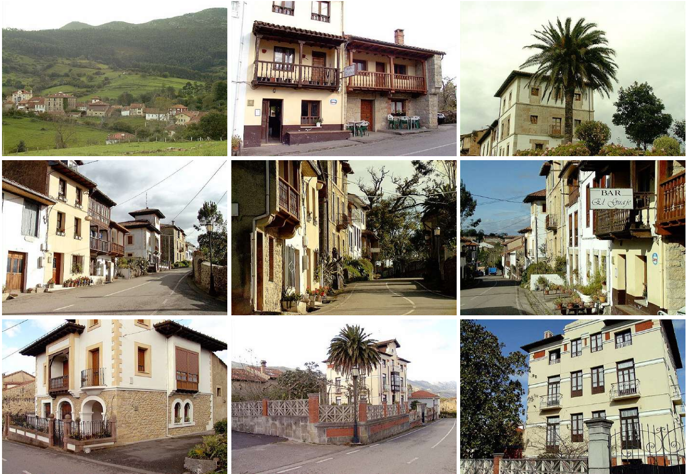
Noriega, vista general y detalles de su arquitectura rural

historiadores en esta casa palacio durmió el rey Carlos I en 1517, a su llegada a España camino de ser coronado rey.