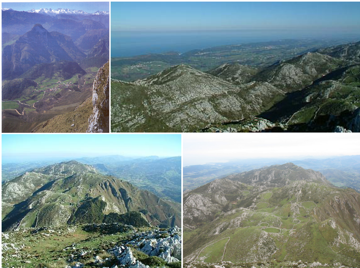
Vistas desde el Pico el Paisano. En la primera, el pueblo de Llonín junto al pico Pendendo (532 m)

La cumbre del Pico El Paisano (804 m) está ocupada por la capilla de San Antonio. La panorámica es realmente buena: al N se extiende el Valle Oscuro (Concejo de Llanes), la casi totalidad del concejo de Ribadedeva y el mar, dominándose toda la costa occidental de Cantabria; por el E la vista alcanza hasta las montañas pasiegas y Peña Sagra; hacia el S se contemplan los tres macizos de los Picos de Europa y sus estribaciones, destacando en particular el Naranjo de Bulnes; al O se levantan las cimas culminantes de Cuera, destacando Cabeza Torbina, prolongación de este cordal. La vista es especialmente aérea sobre el Valle de Peñamellera, al Sur y Sureste, con el pico Peñamellera como divisoria de los dos concejos en primer plano; casi debajo de la cumbre el pueblo de Llonín con su ramal de carretera que enlaza con la del desfiladero del Cares y más a la izquierda el alargado pueblo de Abándames (pueblo natal del paisano), en la zona más amplia del valle, y las casas de Panes al otro lado del río Deva.