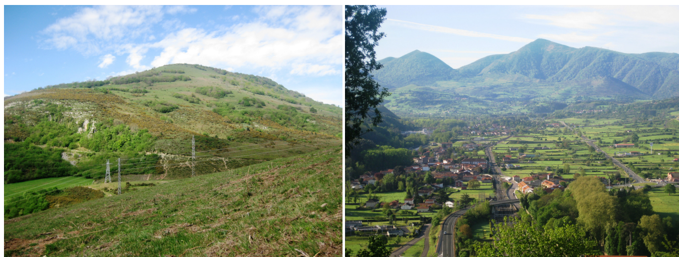
Cueto del Agua desde la Sierra de Pedredo y Las Fraguas. El Valle de Iguña y Pico Jano, al fondo, desde el Mirador de La Corona.

En la segunda curva a la derecha, junto al derruido Caserío de Canete (600 m) se deja el camino para rodear el prado de estas ruinas y después seguir bajando por los caminos del ganado hasta el Collado de Piedrahita (354 m).